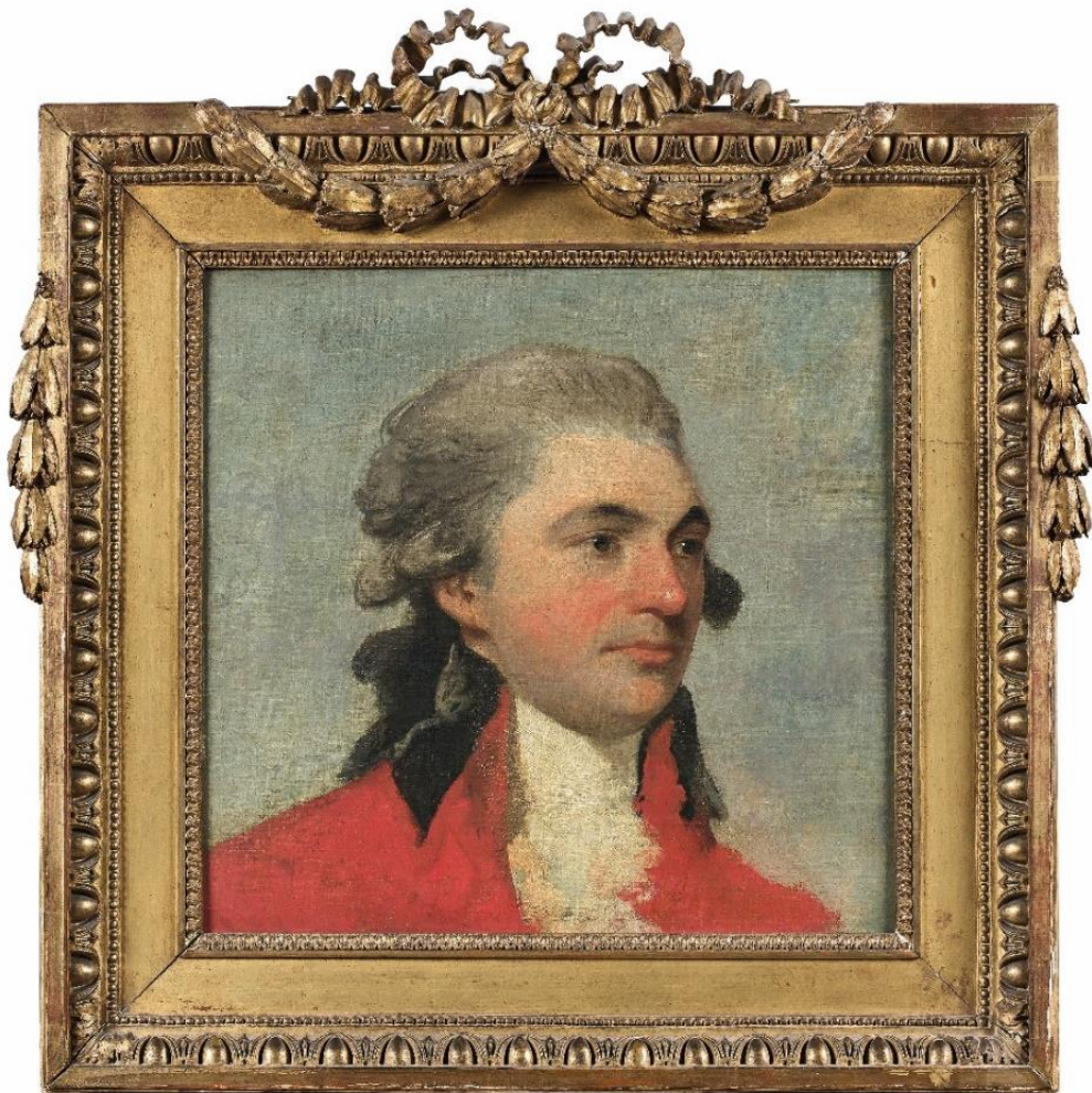
Gilbert Stuart (Saunderstown 1755 – Boston 1828) Portrait de William Bingham, toile, 45 x 46,5 cm

Notre portrait peint en 1784 est le premier portrait de William Bingham, alors qu'il est en Angleterre pour des raisons commerciales, probablement commandé pour asseoir ses positions et marquer le début d'un grand avenir.