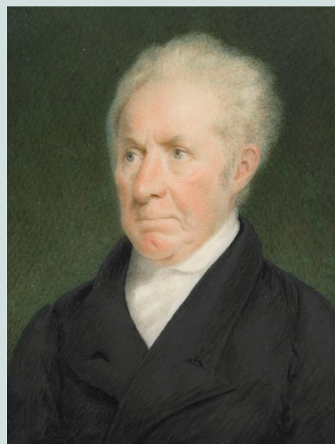
Portrait de Gilbert Stuart par Sarah Goodridge (1825)

Gilbert Stuart compte parmi les tous premiers peintres américains à la fin du 18 ème siècle. Sa jeunesse est itinérante entre la Côte Est des Etats-Unis et le Royaume-Uni. Il complète sa formation en Écosse en 1771, à Londres entre 1775 et 1787, où il assiste Benjamin West et devient proche de Joshua Reynolds. Il obtient un grand succès avec son portrait de William Grant en Patineur , exposé en 1782, à la Royal Academy de Londres. Il continue sa carrière à Dublin avant de retourner à Philadelphie en 1794, où il peint George Washington, premier portrait officiel d'un président américain. Il s'impose ensuite comme le principal portraitiste des grandes villes de la Côte Est. Il s'installe à Washington en 1803, devenue capitale officielle des Etats-Unis et brosse l'effigie des premiers Pères fondateurs et des membres de l'administration fédérale.